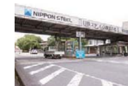
玄関看板 日鉄ステンレス(株) (山口県光市)