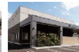
サイン・笠木 向西会館 (山口県光市)