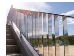
フェンス ユニット式で施工容易、サビに強い 聖光高等学校 (山口県光市)