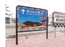
看板 長寿命、印刷面の特殊加工 茶臼山古墳 (山口県柳井市)