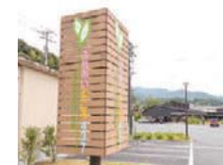
看板 木材とステンレスの調和 ふれあいどころ437 (山口県柳井市)

ステンレス製のサイン(看板)・モニュメントは、錆や汚れが付着しにくく光沢があり、高級感を演出できます。