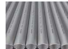
ステンレスパイプ