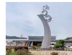
モニュメント 高耐食性(NSSC270) 光駅前 (山口県光市)