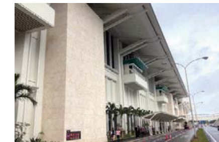
幕下パネル 那覇空港連絡ターミナル (沖縄県那覇市)

ステンレス製の建築部材(笠木・見切り・サッシ)は、錆びや汚れに強く光沢があり、高級感を演出できます。